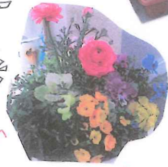
経営支援室前のお花をキレイに咲かせています。