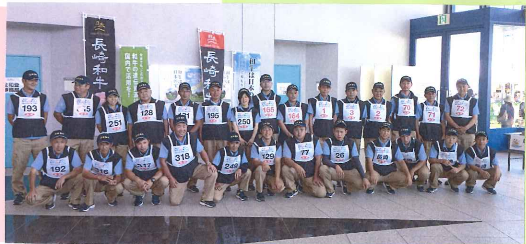
△ 県代表、出品者のみなさん