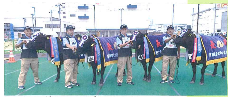
△ 第5区 県代表のみなさん