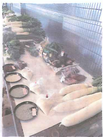
△続々と受賞野菜が決まっています