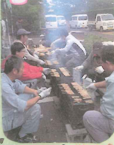
いい匂いね〜♪ブタバラ