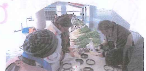
△米検査員が白米を審査しています。