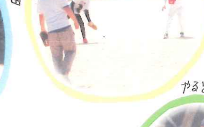
飛快の走り!! 半端なリフト!! (笑)