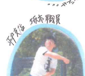
平出張センター 支部職員

ところでみなさん... Tシャツのデザインとなっている方はこの中のどなたでしょう? 分かった方はこっそり教えてください(笑)