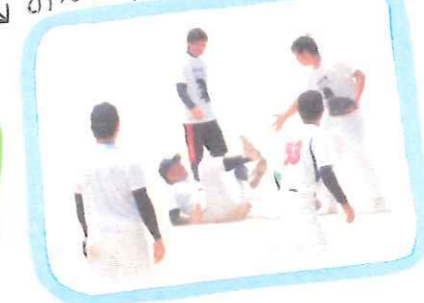
俺の愛球を受け取る!!