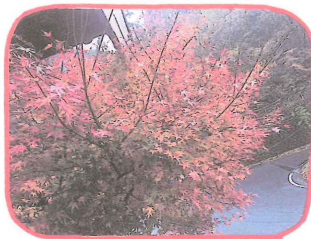
きれいな紅葉でした!!