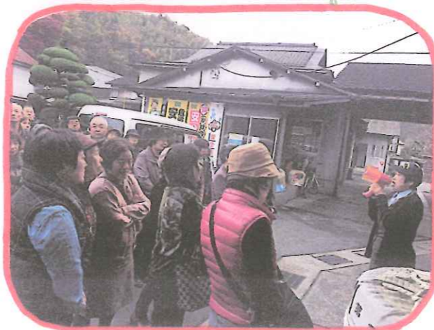
八鹿酒造にて。試飲のあとお酒をたくさん 買われて ました。

今回は職員も含め、総勢38名 で大分県へ行ってきました!! あいにくのくもり空でしたが皆 さん、とても楽しまれました。 参加していただいたみなさん、 ありがとうございます!