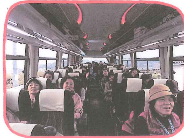
楽しい笑い声が聞こえて ました☆ バスの中にて...