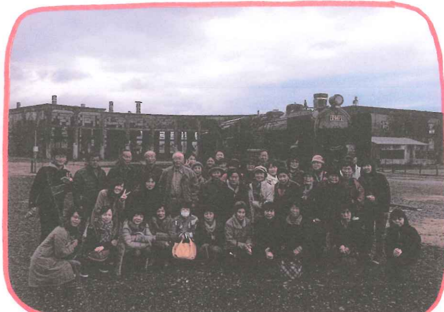
↑ 豊後森機関庫ミュージアムにて記念写真😊