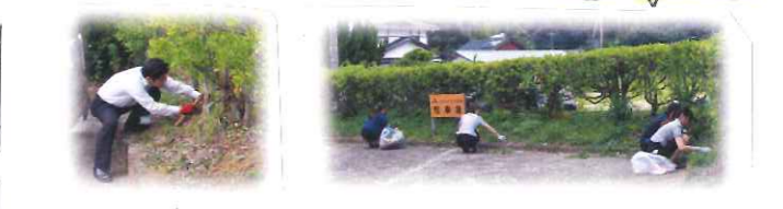
職員全員で環境整備を行いました!!

この度、職員馬主車場を変更し、現在の馬主車スペースを全面お客様駐車場としてご利用いただけるようになりました!! 支店・資材センター前の馬主車は、バス等の通行の妨げとなる場合がございますので、車ごと来店の際は、馬主車場をご利用下さい!! ようお願い致します(★い★)