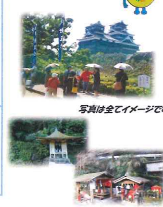
写真は全てイメージです