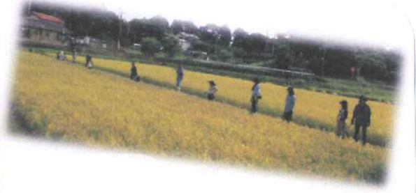
最後にみんなでハイチーズ!