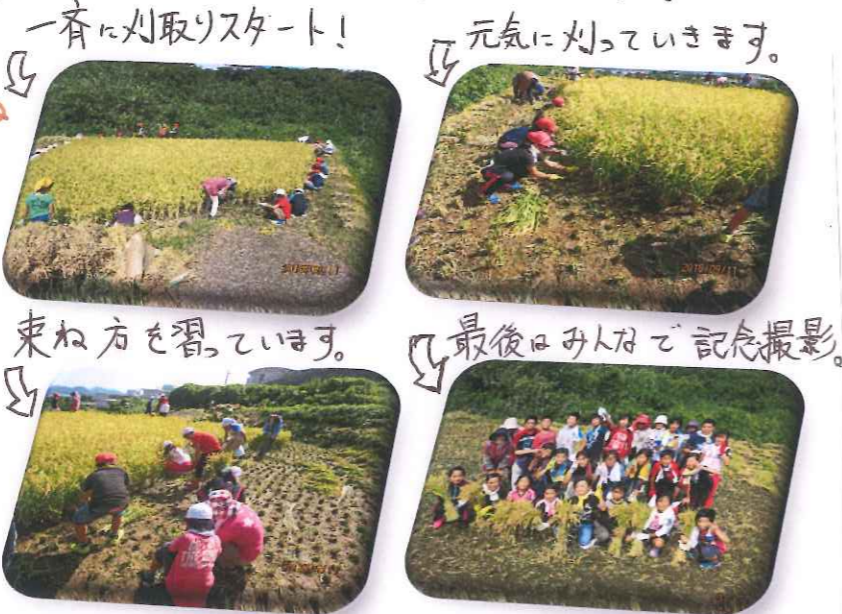
一斉に刈取りスタート!