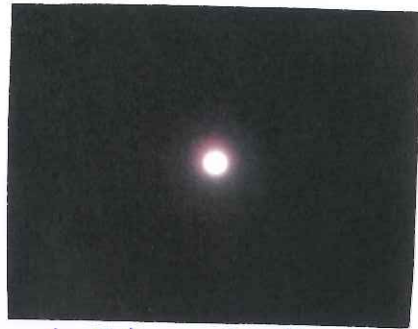
中秋の名月 支店駐車場にて撮影

過ごしやすい季節ですが、朝晩が 冷えるので健康面には十分気をつけてください さて、農協では女性職員の制服が3年ぶりに新 なりました