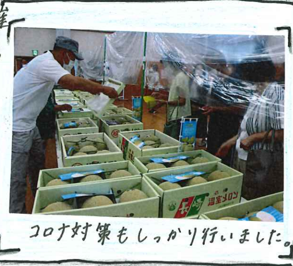
コロナ対策もしっかり行いました。