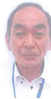
立山職員 事故センターへ 異動

慣れないことが多く ご迷惑をお掛けしますが 一生懸命頑張りますので よろしくお願いいたします。