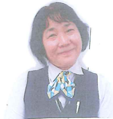
松本職員 平戸支店へ 異動

松浦地区には、上高松 の事務所より1年と3ヶ月。松浦支店に 2年間 貯金係としてお世話になりま した。おやく、土地に慣れ、お仕事の経験も 松浦に深まったところでしたが... 江迎鹿町支店に異動となり参りました。 短い間でしたがお世話になりました。 ありがとうございます。