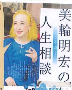
美輪明宏の人生相談

「家の光」が届いたら、まず一番にこのページを開くという人も多く、大気の記事が20周年を迎えました。世間の数だけそれぞれの人生があります。二十一世紀の始まりとともに歩んできた連載を振り返り、これまで掲載した中で反響が大きかったものをお届けします。